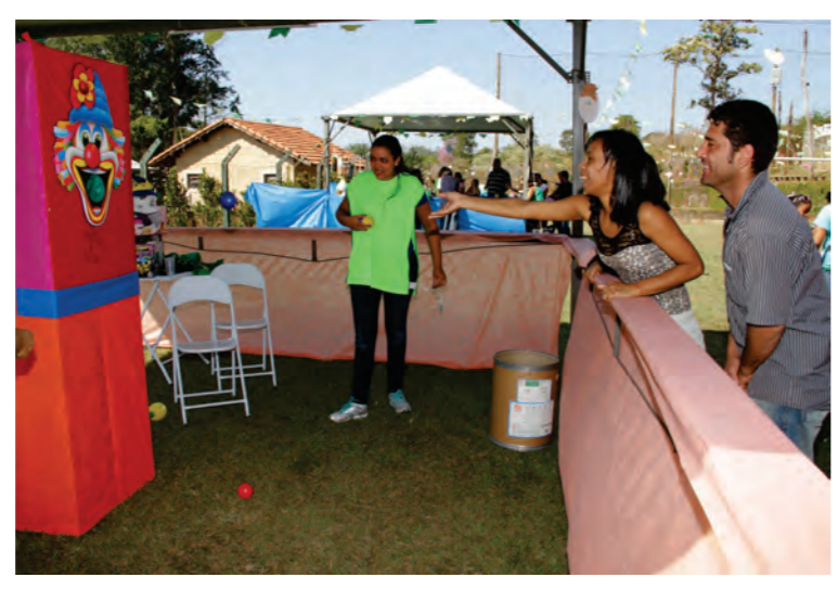
Brincadeiras na Festa

Mais de três mil pessoas compareceram ao segundo ARRAIÁ DO SINDICATO DA CONSTRUÇÃO, MONTAGEM E MOBILIÁRIO DE CAMPINAS E REGIÃO realizado no dia 22 de junho. Um domingo ensolarado com comidas típicas, quadrilha, fogueira, queima de fogos, brincadeiras para as crianças, muita música, além de outras atrações, como o touro adestrado e a Casa do Chico Bento. As famílias dos trabalhadores e trabalhadoras saíram da Festa Junina com a certeza de que foi 'bão demais' este grande momento de lazer e confraternização organizado pela diretoria.