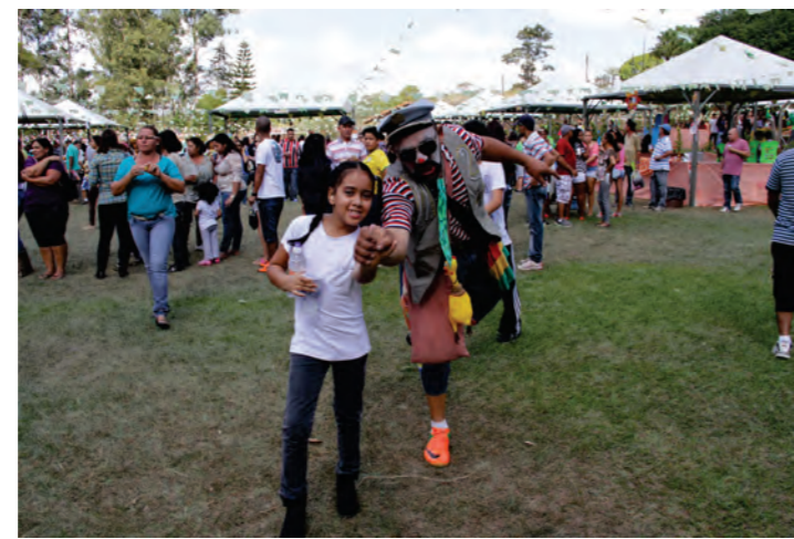
As Crianças se Divertem