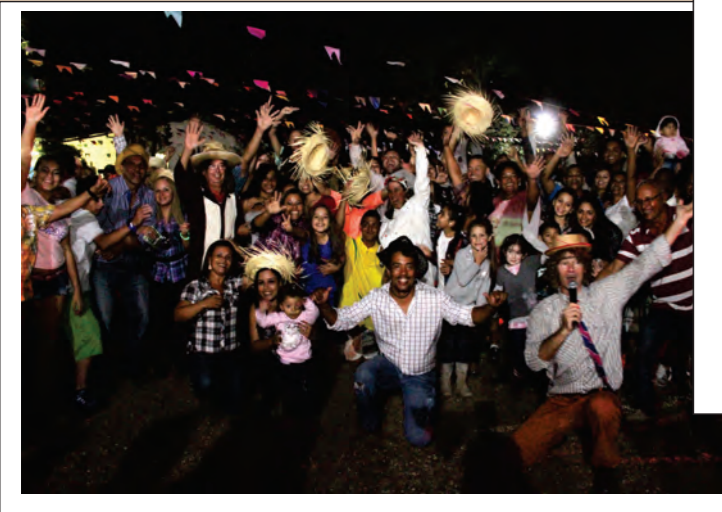
Dança no Momento da Quadrilha