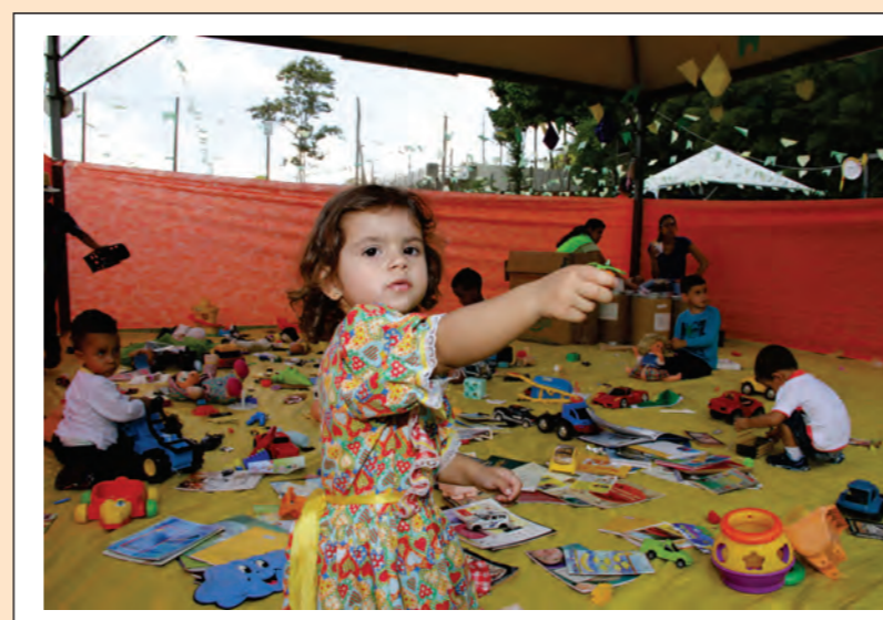
As Crianças se Divertem