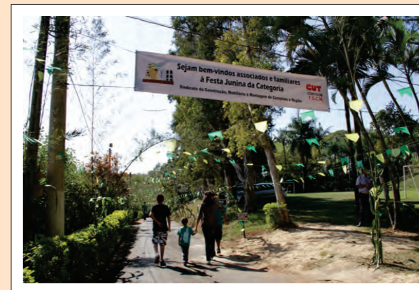
Chegada dos Trabalhadores