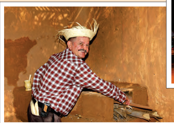
Casa do Chico Bento