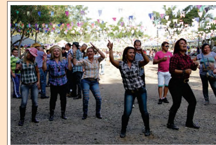
Muita Música e Dança

Mais de três mil pessoas compareceram ao segundo ARRAIÁ DO SINDICATO DA CONSTRUÇÃO, MONTAGEM E MOBILIÁRIO DE CAMPINAS E REGIÃO realizado no dia 22 de junho. Um domingo ensolarado com comidas típicas, quadrilha, fogueira, queima de fogos, brincadeiras para as crianças, muita música, além de outras atrações, como o touro adestrado e a Casa do Chico Bento. As famílias dos trabalhadores e trabalhadoras saíram da Festa Junina com a certeza de que foi 'bão demais' este grande momento de lazer e confraternização organizado pela diretoria.