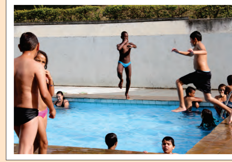
As Crianças se Divertem