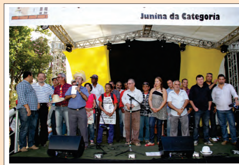
Apresentação da Diretoria e Convidados