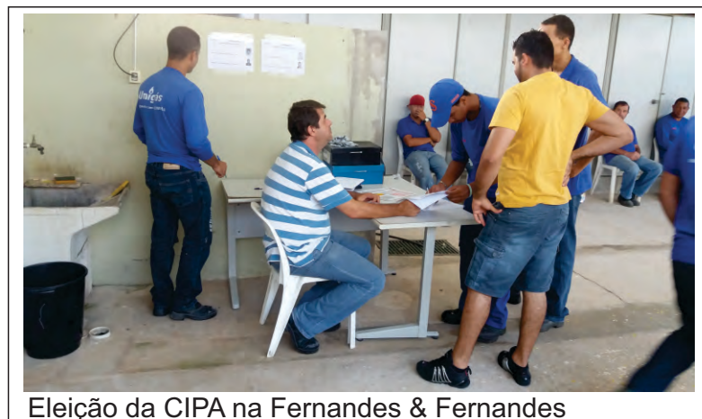
Eleição da CIPA na Fernandes & Fernandes

Fernandes, de Campinas, que realizou a eleição no dia 05 de fevereiro. Companheiros e companheiras, caso a sua empresa tenha a obrigação de instalar a CIPA e não está cumprindo a lei, procure o Sindicato e denuncie.