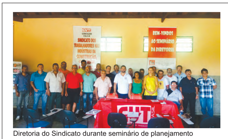
Diretoria do Sindicato durante seminário de planejamento

A diretoria do Sindicato promoveu nos dias 19 e 20 de fevereiro o seminário de planejamento das atividades e lutas para 2016. O encontro foi realizado na Chácara São Lucas.